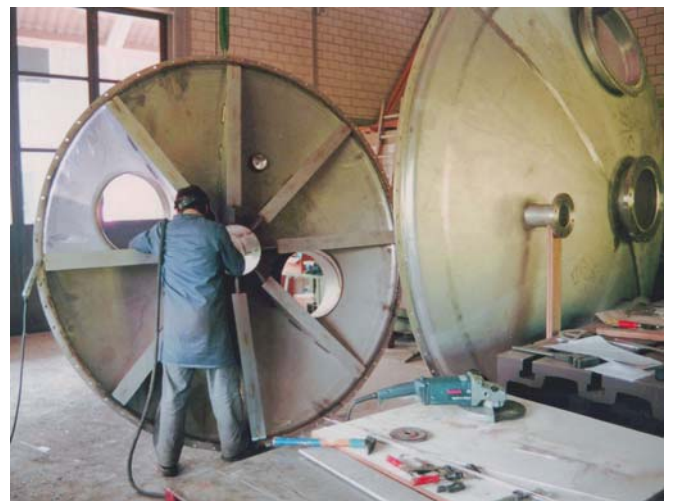
Werkstatt für rostfreien Stahl

Um Verunreinigungen in der weissen Werkstatt zu vermeiden, steht für die Herstellung von Teilen aus herkömmlichem Schwarzstahl eine separate Werkstatt zur Verfügung.