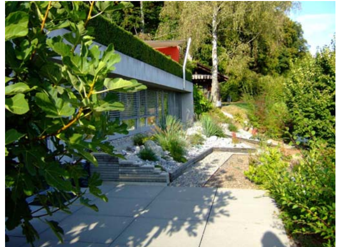
Firmensitz DI-TEC GmbH

Seit der Gründung der Firma DI-TEC GmbH 1996, konnten wir unsere Kompetenzen im Bereich der Klärwerkstechnik stetig ausbauen.