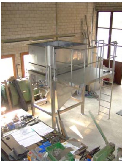
Vorlagebehälter für die Textilindustrie